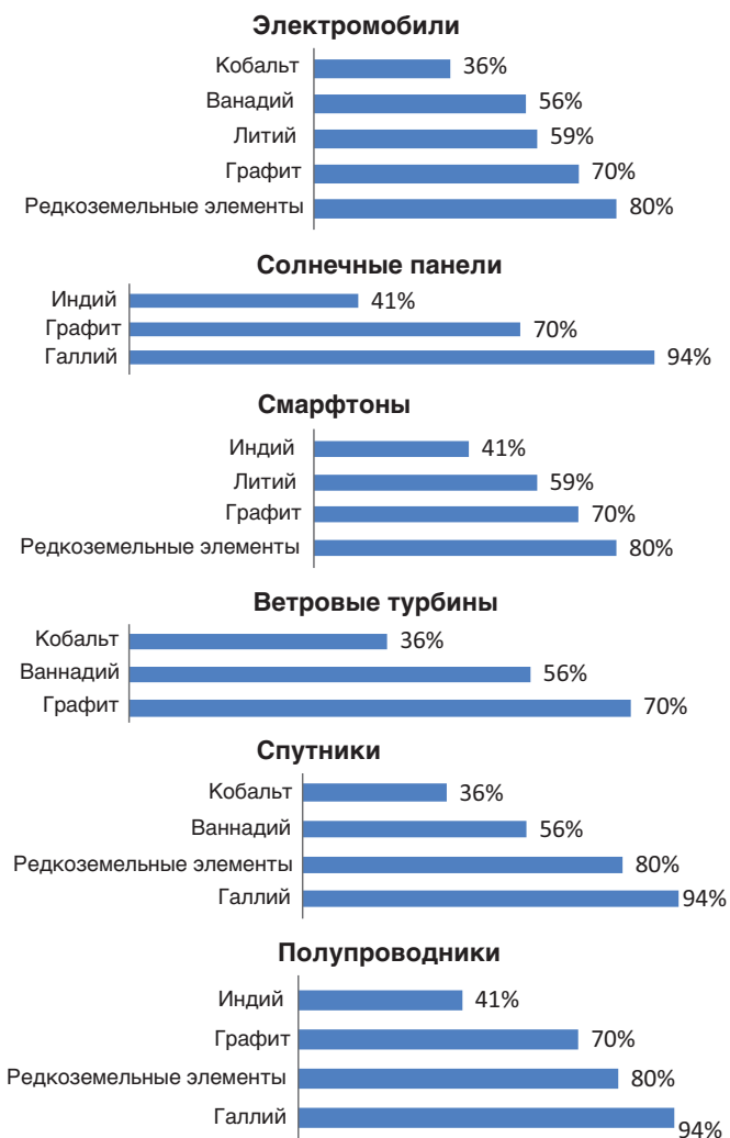
Рис. 3 Мировой контроль Китая над критически важными материалами и металлами, питающими современные технологии, %

Источник: Mining the future. How China Is Set to Dominate the Next Industrial Revolution. FP analytics special report. May 2019