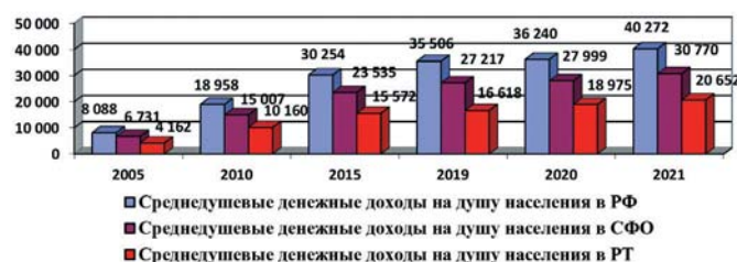
Рис. 2 Динамика среднедушевых денежных доходов населения в месяц, руб.

Compiled by the author based on data from the Federal State Statistics Service (Regions of the Russian Federation Statistical Compilation; Social and Economic Indicators. 2021 (In Russ.) Available at: https://gks.ru/bgd/regl/b21_14p/Main.htm )